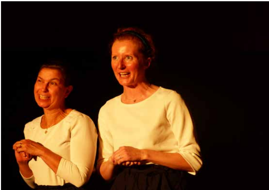
Répétition générale 30/06/2018 - CSC Jaunais Blordière (Rezé-44)

Parents, amies, cousin, chacun tour à tour se raconte entre souvenirs et présent au fil de saynètes aiguisées de mots à mâcher et façonnées d'histoires entremêlées de facétie et d'absurde.